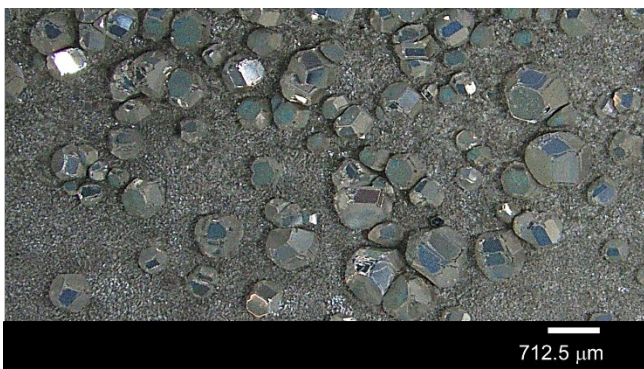
図 3. 製錬された金属 Mg の拡大写真